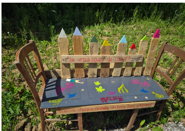
Création en bois ludique pour les enfants

L'association Les AJOnc est intervenue cette année pour mettre en place un collectif et aménager le site (bacs de plantation en bois, cheminements, tressage pour délimiter les zones de culture, signalétique pour identifier les plantes...). En 2025, elle installera des parcelles individuelles (plantations, mises en culture) puis l'année suivante, elle mettra en place des animations culturelles. L'association est à l'origine du premier jardin partagé de France, à Lille en 1997, avec un principe essaimé dans toute la région.