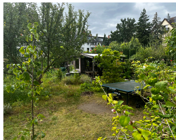
Du ping-pong pour passer un bon moment en famille