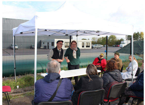
Présentation du projet aux habitants en octobre 2023

Pour amorcer le fleurissement d'actions en matière de biodiversité, Pas-de-Calais habitat en partenariat avec l'entreprise Bloom'Act a installé deux ruches en octobre 2023. La première récolte fructueuse était destinée aux Restos du Cœur.