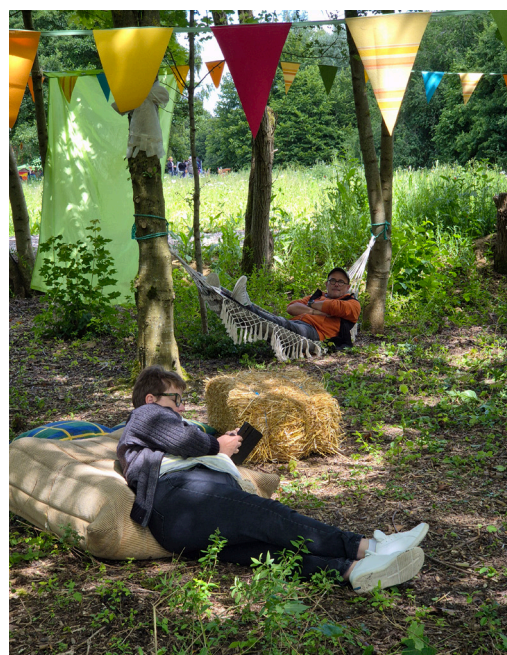
Aménagements propices à la déconnexion en pleine nature