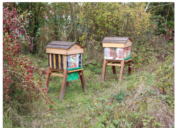
Deux ruches installées par l'entreprise Bloom'Act