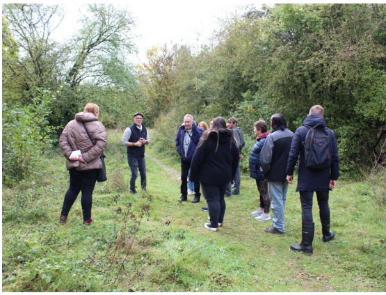
Visite sur le site avec les habitants en octobre 2023

Après la reconquête de ses logements vacants, Pas-de-Calais habitat s'attèle à la reconquête d'une friche de 6 hectares bordée par des espaces boisés à Sains-en-Gohelle. Sur cet ancien site minier, propriété du bailleur, devenu «le Bois aux oiseaux», on y cultive du lien social, de la solidarité, de la convivialité mais aussi diverses espèces de plantes, fruits et légumes, dans le respect de la nature. Ce projet prend forme depuis 2023, en partenariat avec l'association AJOnc (Amis des Jardins Ouverts et néanmoins clôturés).