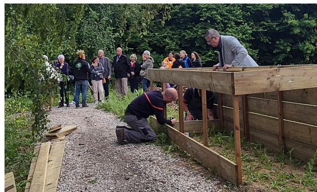
Installation du composteur «fait maison»

Sur ce même site, Pas-de-Calais habitat prévoit également de construire une maison des associations avec un espace cuisine, une salle de réunion, une outilthèque et un espace partagé. L'organisation de temps festifs (apéros, expositions, projections de films, fête de la musique...) sera également un moyen d'ouvrir le Bois aux oiseaux à l'ensemble des habitants et aux partenaires.