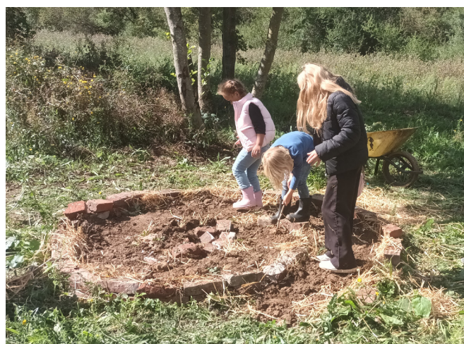
Plantation en spirale