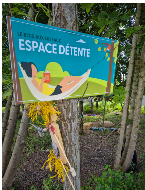
Signalétique mise en place par Pas-de-Calais habitat