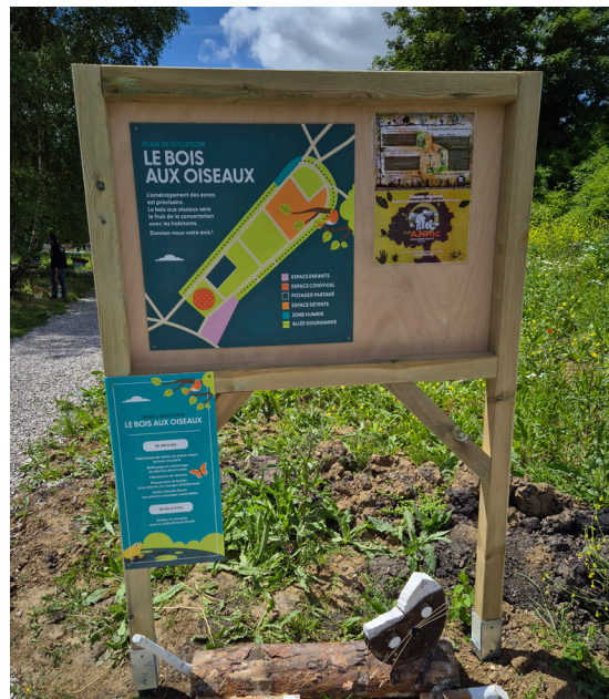
Entrée matérialisée par un panneau d'information et un plan