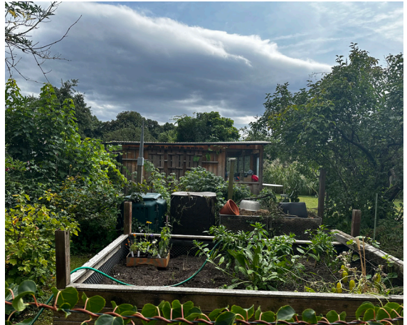
Un exemple de jardinage hors-sol à Cologne

Le modèle permet donc aux locataires de s'isoler dans leur parcelle, tout en étant dans un lieu qui a pris vie et qui continue à se développer collectivement.