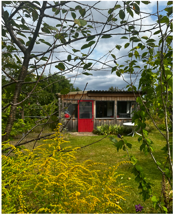
Un petit coin paisible de repos