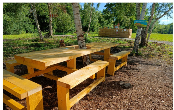
Installation d'une table de banquet