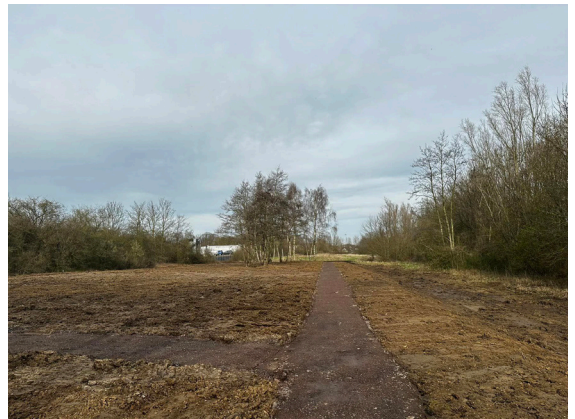
Aménagement des parcelles avec de la terre