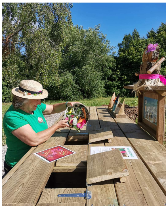
Les fleurs comestibles bientôt de l'humus pour les plantations